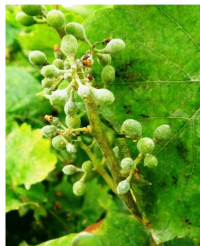
Ωίδιο. Σε νεαρές ράγες