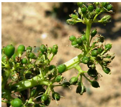
Καρπόδεση – νεαρές ράγες σε ανάπτυξη