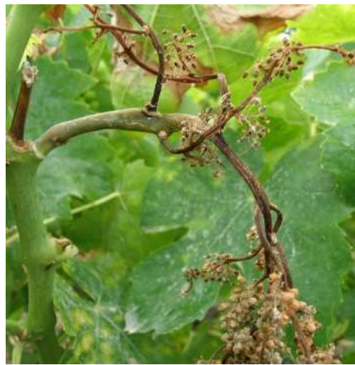
Περνόςπορος. Προσβολή στο σταφύλι. Μοιάζουν με «βρασμένα χόρτα», ξεραίνονται τμήματα ή και ολόκληρα σταφύλια παίρνοντας συχνά σχήμα S (δεξιά φωτογραφία)