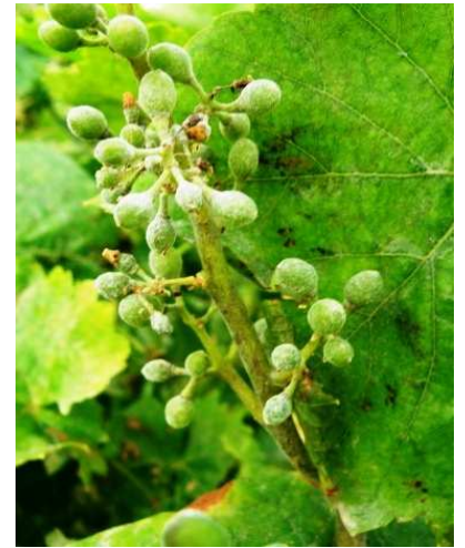
Ωίδιο. Σε νεαρές ράγες