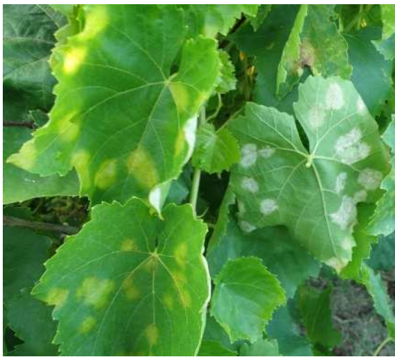
Περνόςπορος. Κηλίδες λαδιού στην πάνω πλευρά και λευκό χνούδι (σπόρια) μόνο στην κάτω πλευρά με υψηλή βραδινή υγρασία