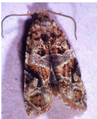
Ευδεμίδα. Τέλειο έντομο. Πεταλούδα περίπου 1εκ.