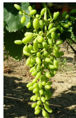
Ράγες σε ανάπτυξη (κατακόρυφη θέση σταφυλιού)

Τα κύρια βλαστικά στάδια ποικιλίας σουλτανίνα που εμφανίζονται αυτή την περίοδο είναι: