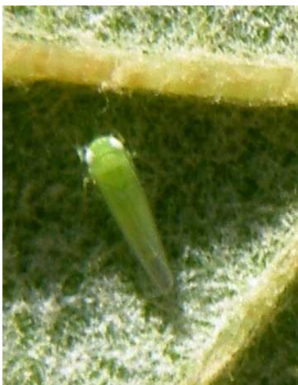
Τζιτζικάκι. Ενήλικο (περωτό) έντομο. Είναι τα μεταναστευτικά άτομα του είδους.