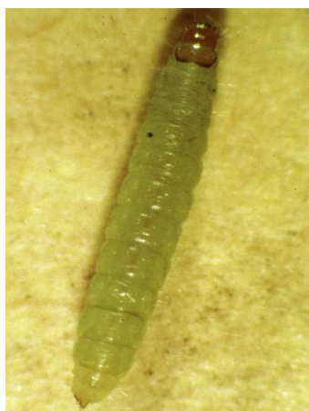
Ευδεμίδα. Προνύμφη πολύ ευκίνητη, μέχρι 1εκ. μήκος.