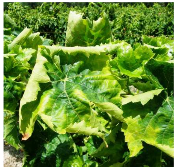
Τζιτζικάκι. Καρούλιασμα και μεταχρωματισμός σε φύλλα ποικιλίας σουλτανί. Στις ερυθρές ποικιλίες ο μεταχρωματισμός είναι κοκκινωπός.