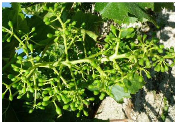
Ράγες σε ανάπτυξη