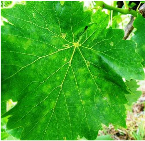
Ωίδιο. Μολύνσεις στο φύλλωμα