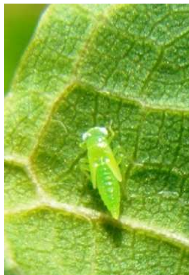
Τζιτζικάκι. Προνύμφη του εντόμου. Δεν πετά, είναι στην κάτω πλευρά του φύλλου, βαδίζει με πλάγια κίνηση.